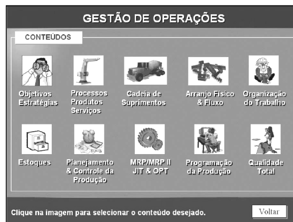
FIGURA 3 – Conteúdos abordados da área de produção e operações

A seguir, o aprendiz tem a sua disposição uma relação atualizada de tópicos que estará a sua disposição para apreciação, bastando clicar no objeto de seu estudo. Este evento dispara uma nova tela (Figura 4) com os diversos recursos computacionais divididos em duas categorias implícitas. A primeira, alguns materiais pré-formatados pelo professor responsável pela área, como por exemplo, slides, apostilas e artigos, que visam reforçar o aprendizado obtido em sala de aula. A segunda, algumas aplicações que permitem, por suas características técnico-pedagógicas, o desenvolvimento do pensamento crítico, ou melhor, o aluno por si só vai de encontro ao conhecimento, guiado pelo ambiente em questão.