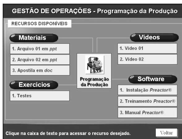
FIGURA 4 – Alguns recursos computacionais disponíveis pelo ambiente