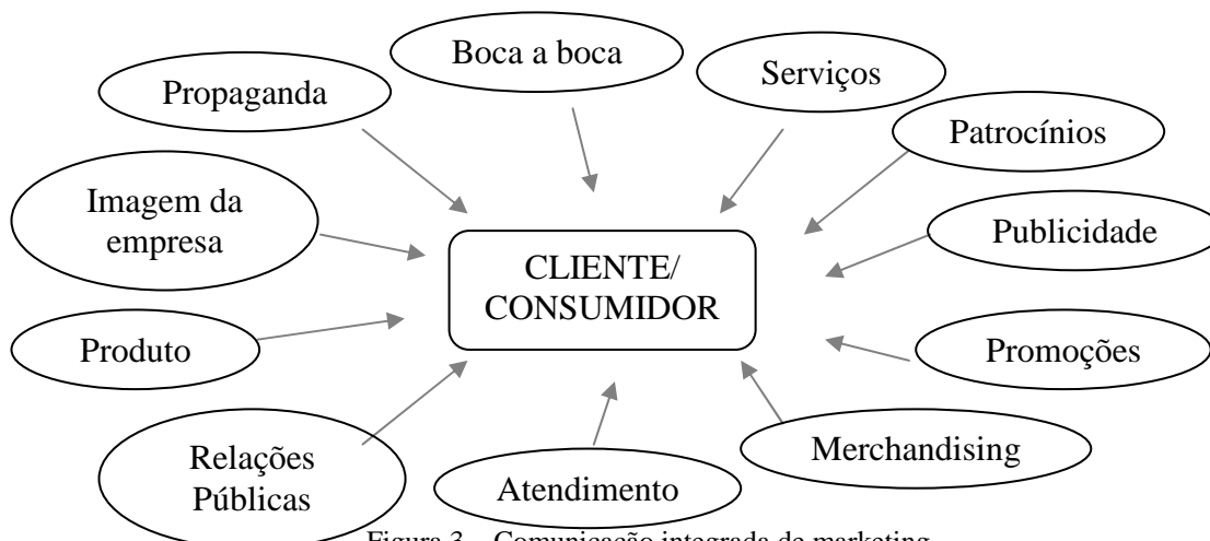
Figura 3 – Comunicação integrada de marketing.

Um programa eficaz de comunicação exige muita experiência profissional e não pode ser relegado ao acaso. Deve ser feito utilizando-se programas, alunos, ex-alunos, campus e um programa formal de comunicações. As publicações da instituição devem ser revisadas em termos de qualidade e consistência de conteúdo e estilo. Sempre que possível, deve-se utilizar canais de comunicação, o mais personalizados possível, e adaptados às características dos segmentos de mercado que a instituição de ensino serve. Uma forma de aumentar o efeito da comunicação é utilizando-se a comunicação integrada de marketing. A comunicação integrada, de acordo com FARIA (2002, p.173), parte do conceito de que tudo o que a organização faz, comunica algo a seu respeito. Seus principais elementos estão representados abaixo pela Figura 3. A Comunicação integrada produz maior consistência na mensagem, maior impacto sobre as vendas, melhor utilização do orçamento, melhor uso/atingimento do tempo, lugar e pessoas.