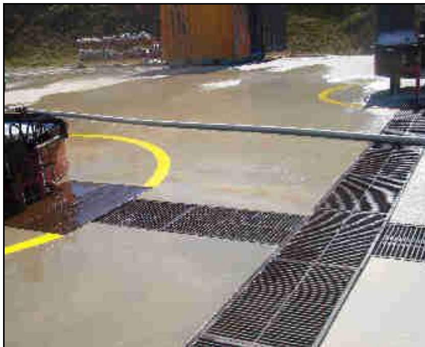
Figura 9 – Vista das canaletas para recuperação da água