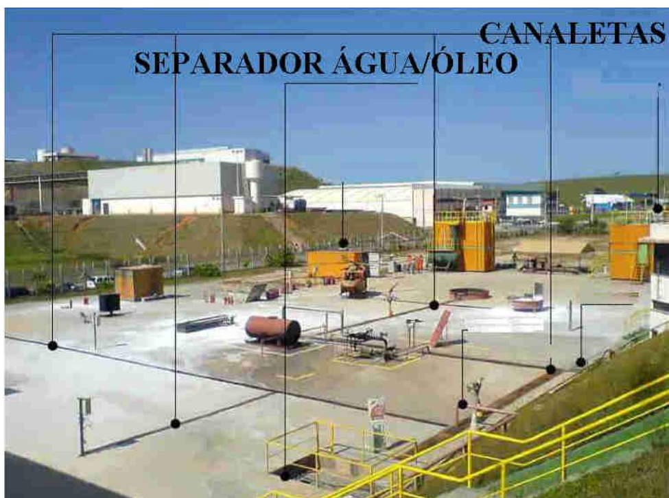
Figura 4 – Centro de Treinamento de Combate a Incêndios

A Figura 4 ilustra o local onde ocorrem os exercícios práticos de combate aos incêndios provocados e identificam o separador de água e óleo (SAO) e as canaletas, bem como os obstáculos para o exercício de combate a incêndio, tais como: maracanã, helicóptero, sistema de processo e casa de máquina.