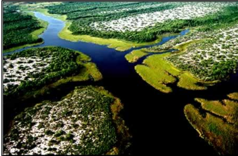
Figura 2 – Vista da lagoa de Jurubatiba em reserva natural

A avaliação e validação do estudo quanto ao reúso de água foi realizado no Centro de Treinamento de Combate a Incêndios (Sampling Planejamento SA), ocupando uma área de 17.000 m 2 e localizado no município de Rio das Ostras (Rio de Janeiro- RJ).