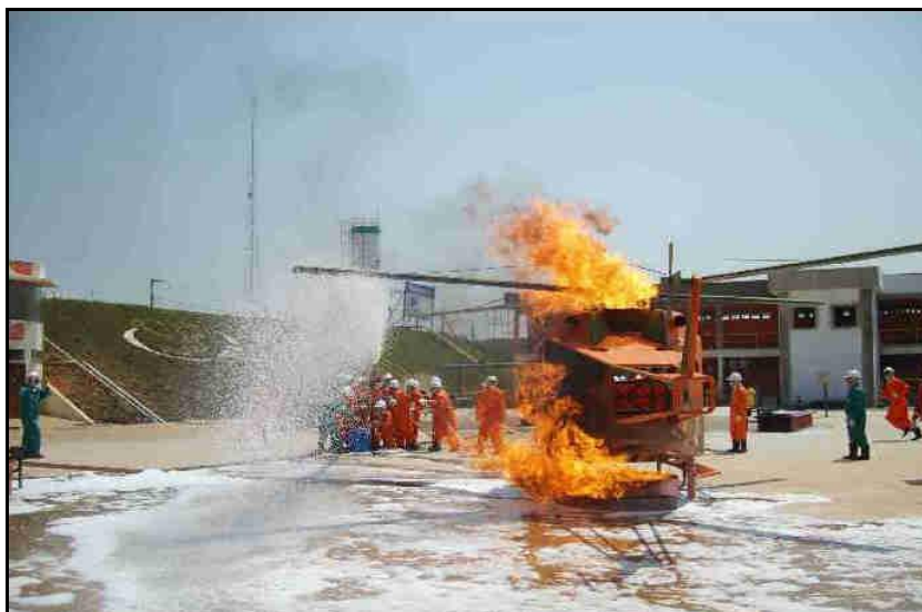
Figura 8 – Combate ao fogo no obstáculo helicóptero

Conforme mostra o fluxograma da Figura 3, o sistema de reúso utilizado neste Centro de Treinamento consta, essencialmente, do seguinte fluxo;