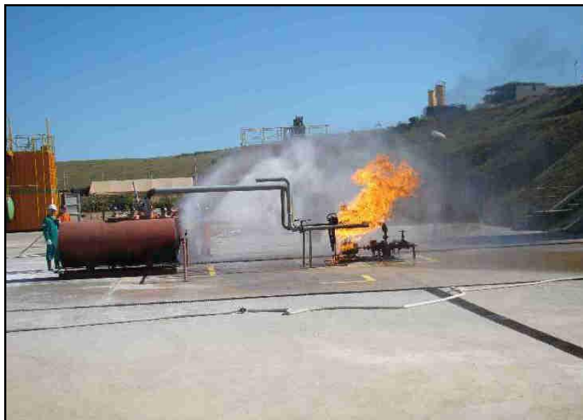
Figura 6–Queima de gás no sistema