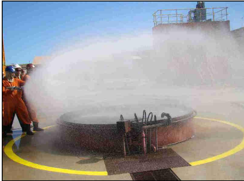
Figura 5 – Combate ao fogo no obstáculo Maracanã