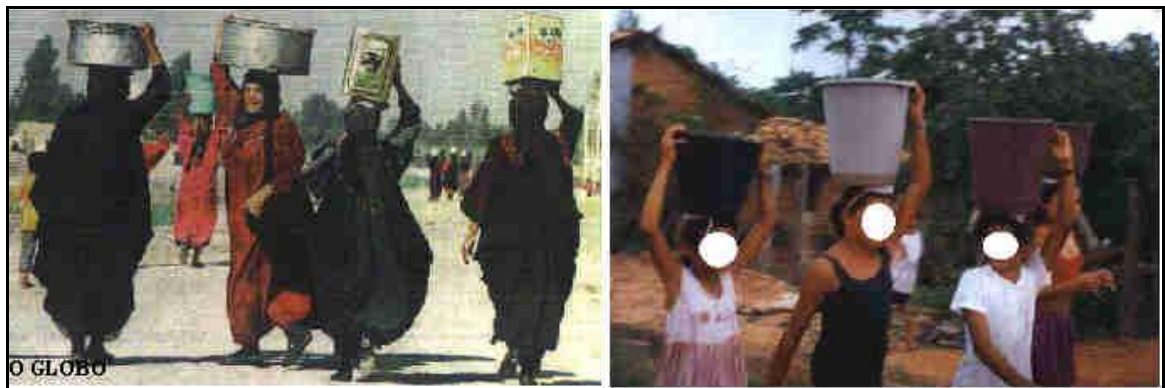
Figura 1: Cenário da falta de água no oriente médio e num vilarejo brasileiro

A Figura 1, a seguir, é o cenário representativo da falta de água no oriente médio e em diversos vilarejos e periferias de cidades brasileiras.