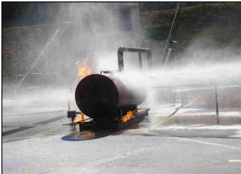
Figura7– Aspecto de aplicação de água no reator