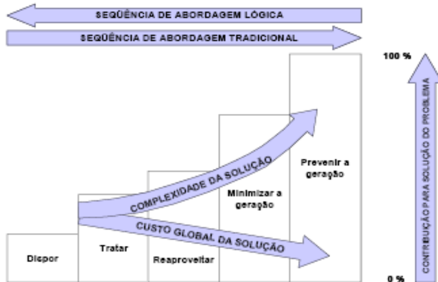
Figura 1: Formas de priorização da nova e da antiga abordagem ambiental.

Cada empresa em particular procura prevenir-se ao acúmulo e lançamento de resíduos no ambiente de seu entorno. Diferentemente, conforme já abordado, da postura tradicional de geração e posterior tratamento de resíduos. A figura 1 a seguir procura explicar a diferença entre as duas abordagens: