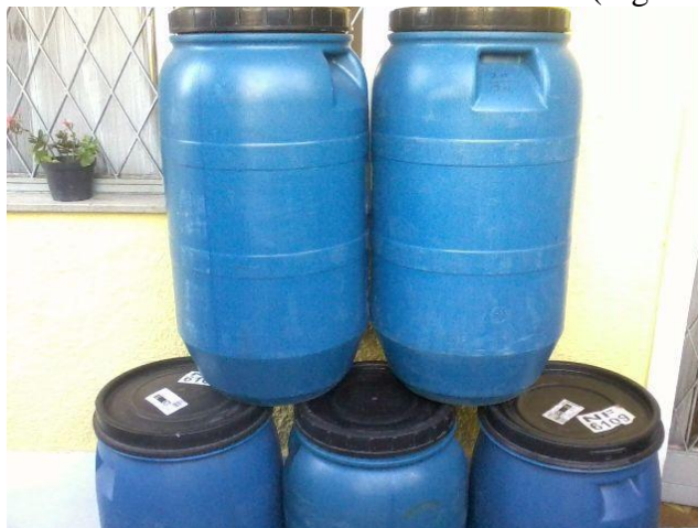
Figura 8 – Embalagem de plásticos triturados de aparelhos celulares

Na etapa de Embalagem os plásticos são triturados e guardados em um tambor. As placas e circuitos são triturados e guardados em um tambor selado. Os materiais reutilizáveis são embalados e os não utilizados são identificados e encaixotados (Figura 8).