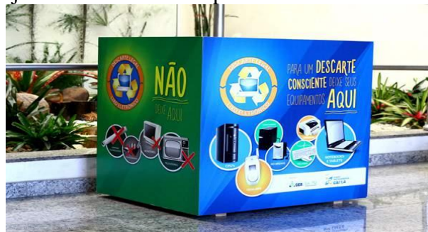
Figura 4 – Coleta e transporte de aparelhos celulares

O processo reverso é formado por cinco etapas: Coleta e transporte; Desmonte e triagem ; Teste de componentes reutilizáveis; Embalagem; Destinação. A etapa da coleta e Transporte envolve o consumidor que tem o papel de entregar os aparelhos pós-consumo nos postos de coletas das lojas das operadoras, das lojas comerciais ou dos postos de assistência técnica (Figura 4).