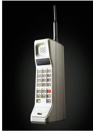
Figura 1 - Primeiro Celular DynaTAC 8000x – Motorola

Várias fabricantes fizeram testes entre o ano de 1947 e 1973, contudo a primeira empresa que mostrou um aparelho funcionando foi a Motorola. O nome do aparelho era DynaTAC® e não estava à venda ao público, este era somente um protótipo. O primeiro modelo que foi liberado comercialmente nos EUA foi o Motorola DynaTAC® 8000x (figura 1), pois alguns outros países já haviam recebido aparelhos de outras marcas, isso ainda no ano de 1983, ou seja, dez anos após o primeiro teste realizado. (JORDÃO, 2010)