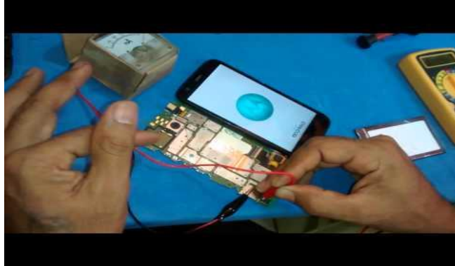
Figura 6 – Teste de componentes reutilizáveis de aparelhos celulares

Na etapa de Teste de componentes reutilizáveis são realizados testes em cima dos componentes reutilizáveis como câmeras, placa de cristal líquido, acessórios (Figura 6).