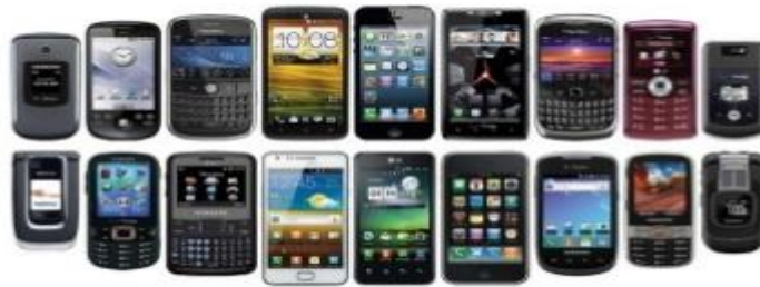
Figura 2 – Evolução dos Aparelhos Celulares

A alta tecnologia aplicada aos aparelhos despertou o interesse dos consumidores que buscam estar conectados em tempo integral com diferentes modelos e marcas (Figura 2).