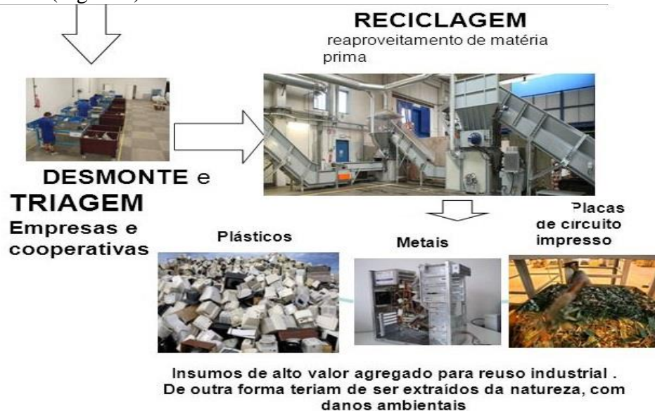
Figura 5 – Desmonte e triagem de aparelhos celulares

Na etapa de desmonte e triagem no armazém o material é contado, pesado, identificado e embalado. Na área de desmonte o material é retirado da embalagem, desmontado e separado em elementos tais como: Plásticos, placas e circuitos; componentes reutilizáveis e componentes não reutilizáveis (Figura 5).