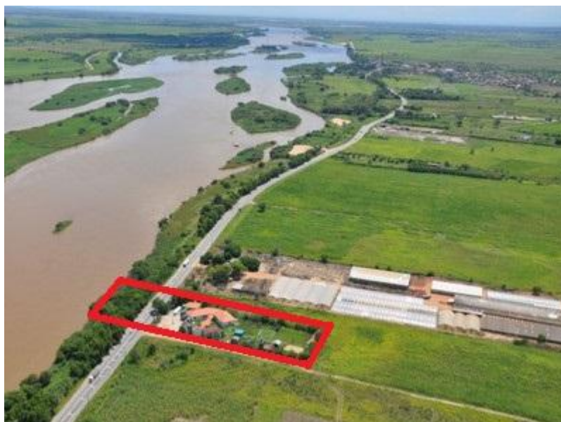
Figura 1: Vista aérea do tabuleiro aluvial da bacia hidrográfica do baixo Paraíba do Sul. Em destaque, o Polo de Inovação Campos dos Goytacazes, RJ.

Racional de Recursos Hídricos. Além do escopo da EMBRAPII, o PICG desenvolve atividades nas áreas Aeroespacial e Telecomunicações, entre outras. Na figura 1 pode-se observar o PICG e sua proximidade com o Rio Paraíba do Sul.