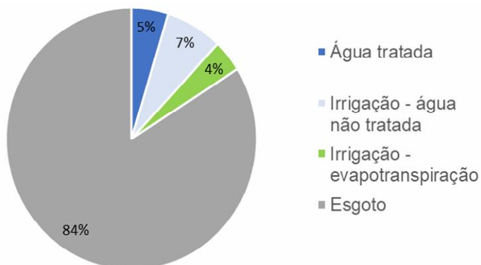
Figura 2: Porcentagem da PH por atividade.

A figura 2 apresenta em forma de gráfico a porcentagem equivalente de cada pegada calculada por atividade.