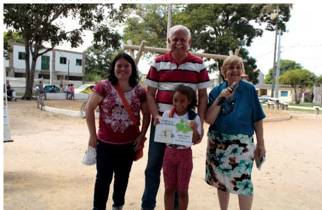
Foto 29 Sorteio e entrega de brindes e livros sobre a natureza

Fonte: Projeto Parcerias e Cultura na Praça Abril, 2018