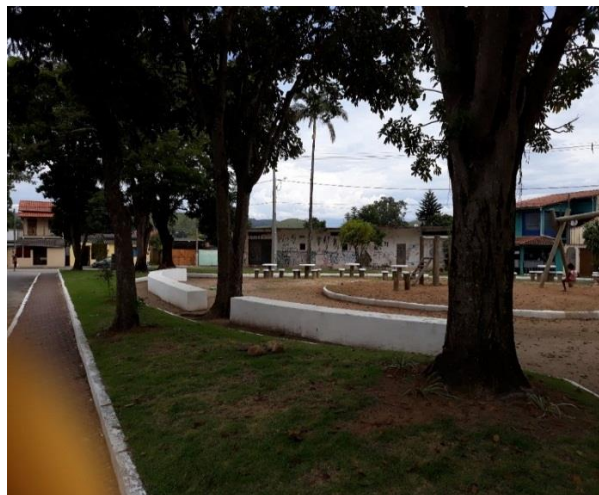
Foto 2 Estrutura física atual da Praça 2018

Fonte: Acessada em 05.06.2018 Site Prefeitura de Itatiaia,