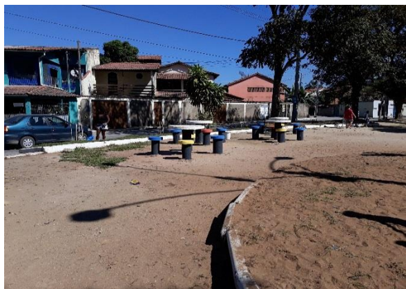
Foto 6 Revitalização da praça pintura

Fonte: Projeto parcerias e Cultura na Praça Abril,2018