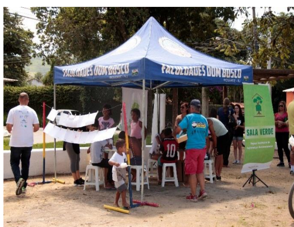
Foto 15 Mural Cultural

Fonte: Projeto Parcerias e Cultura na Praça Fonte: Projeto Parcerias e Cultura na Praça Março, 2018