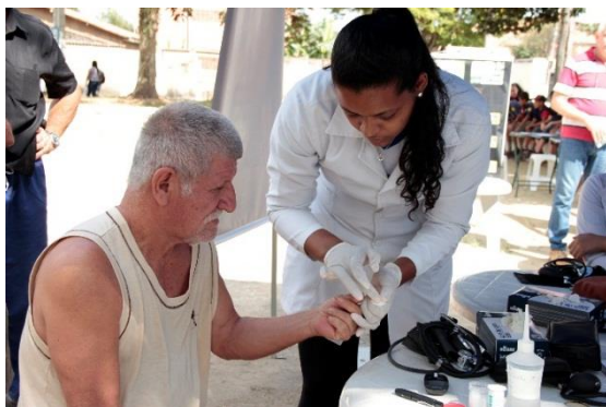
Foto 26 Alunos da AEDB do curso de enfermagem aferindo a pressão presente

Foto 25 Alunos da AEDB do curso de enfermagem medindo glicose do público arterial do público presente