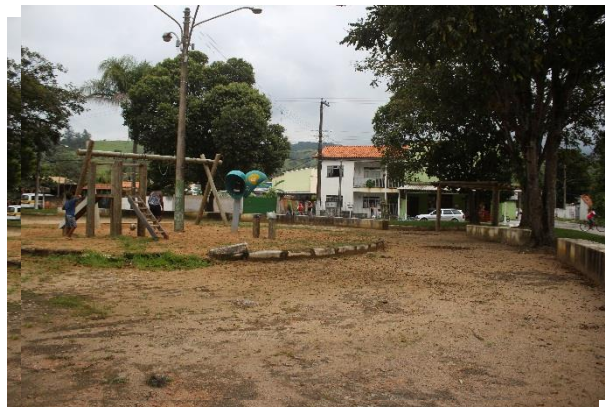
Foto 4 Situação da Praça, janeiro 2018