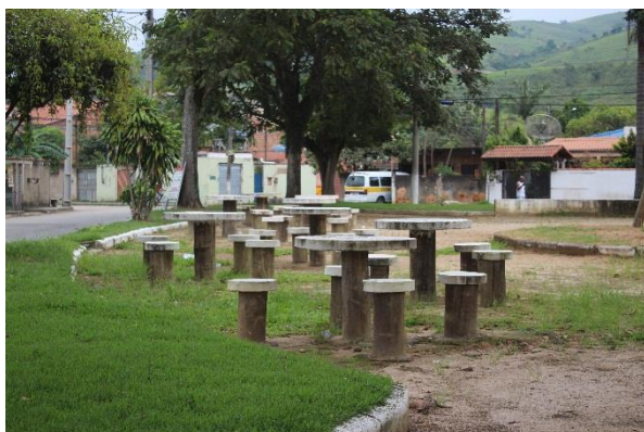
Foto 3 Situação da Praça, janeiro 2018

Em pouco tempo, a praça passou a ser ocupada por dependentes químicos, impedindo atividades escolares, visitas de famílias com crianças, causando incômodo para moradores vizinhos da praça, que se sentiram cerceados em seus direitos de ir e vir nas proximidades da praça, especialmente, em horário noturno