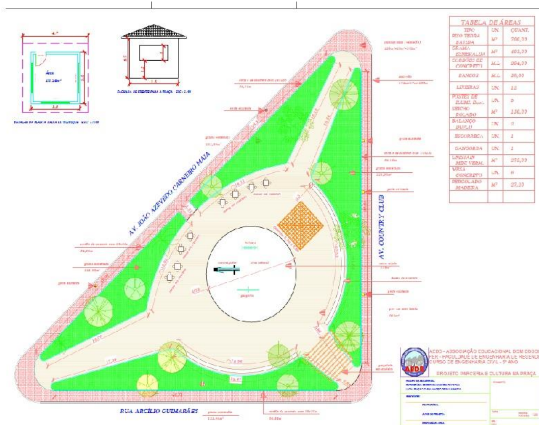
Figura 1 Praça Campo Alegre – Planta Baixa 2016.