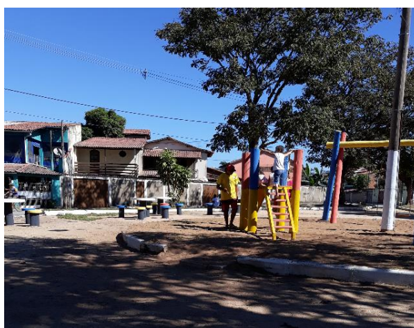
Foto 8 Revitalização e pintura da praça

Fonte: Projeto Parcerias e Cultura na Praça Maio,2018