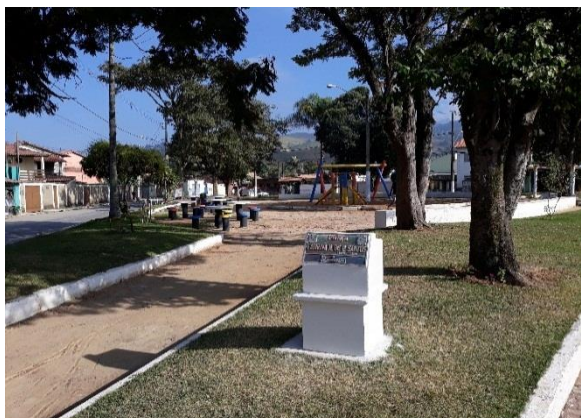
Foto 5 Reconstituição do placa de