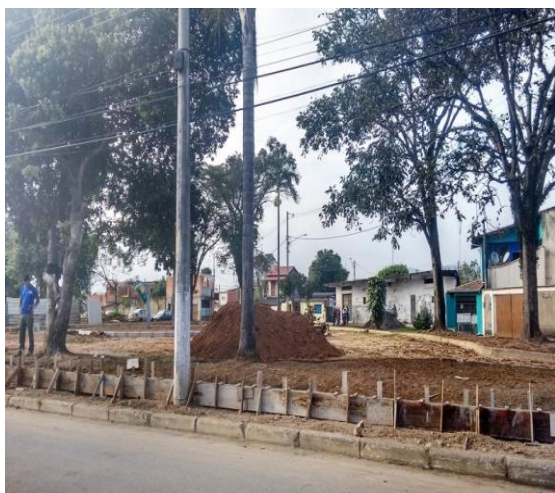
Foto 1 Revitalização da Praça 2016

Fonte: Acessada em 05.06.2018 Site Prefeitura de Itatiaia,