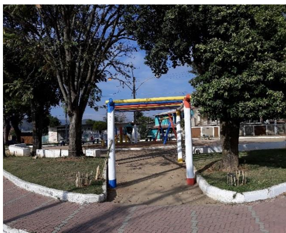
Foto 7 Revitalização e pintura da praça .

Fonte: Projeto Parcerias e Cultura na Praça Maio2018