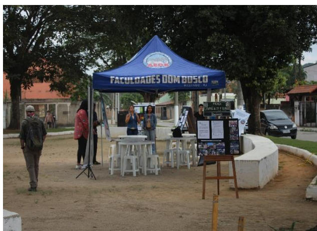
Foto 14 Tenda da AEDB

Fonte: Projeto Parcerias e Cultura na Praça Fonte: Projeto Parcerias e Cultura na Praça Março, 2018