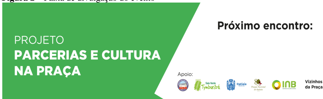
Figura 2 Faixa de divulgação do evento

arte elaborada pelo Núcleo de Informação e Comunicação-NIC da AEDB Informação Técnica: lona ,3mx0;80m