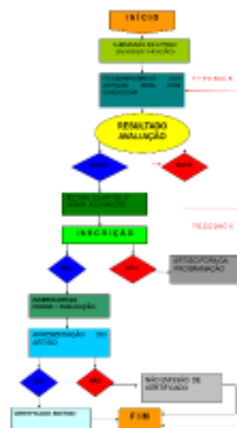
Figura 1 - Fluxograma de atividades do SEGeT

Figuras devem ser numeradas e com a descrição da legenda.